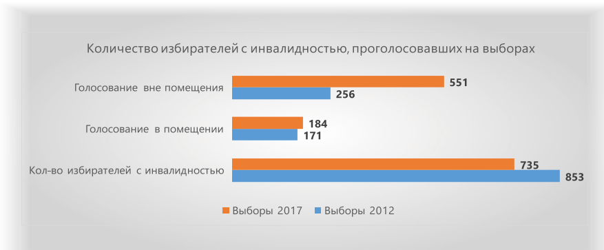
Рисунок 4. Количество избирателей с инвалидностью, проголосовавших на выборах депутатов Законодательного Собрания Краснодарского края 2012 и 2017 годов