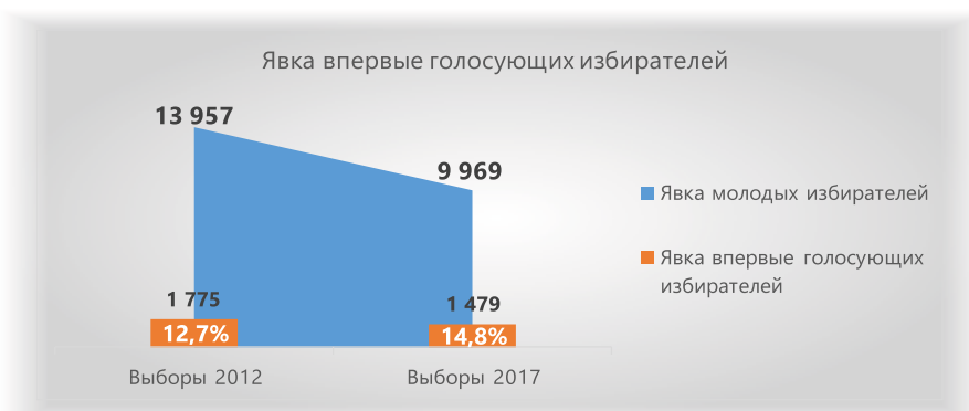
Рисунок 3. Явка впервые голосующих избирателей на выборах депутатов Законодательного Собрания Краснодарского края 2012 и 2017 годов