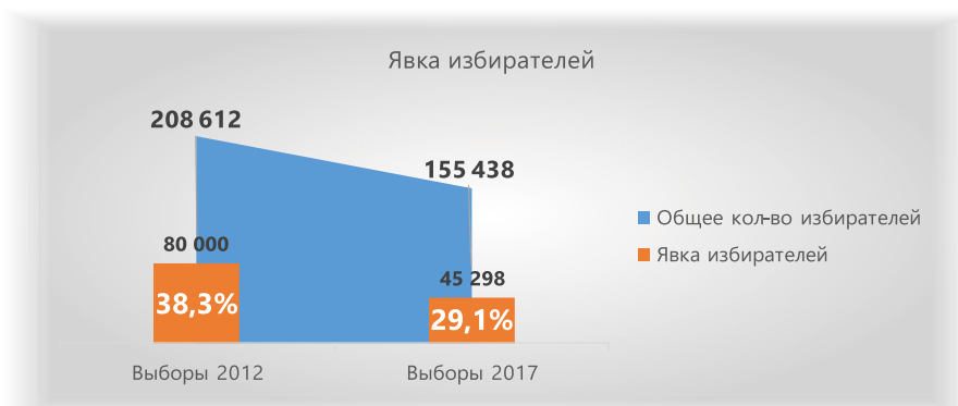
Рисунок 1. Явка избирателей на выборах депутатов Законодательного Собрания Краснодарского края 2012 и 2017 годов