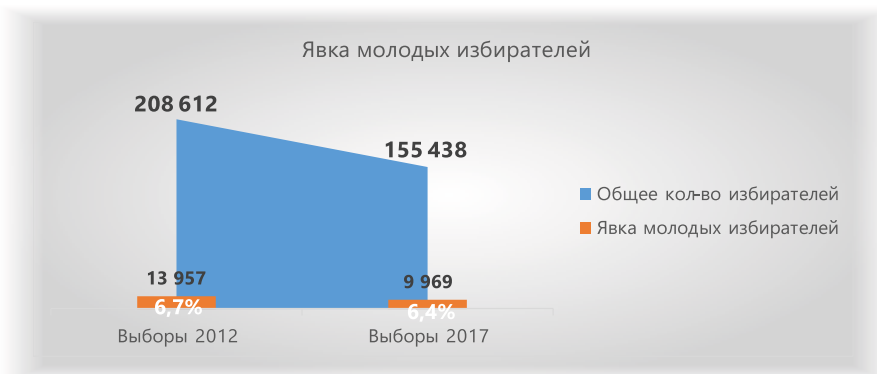
Рисунок 2. Явка молодых избирателей (в возрасте от 18 до 35 лет) на выборах депутатов Законодательного Собрания Краснодарского края 2012 и 2017 годов